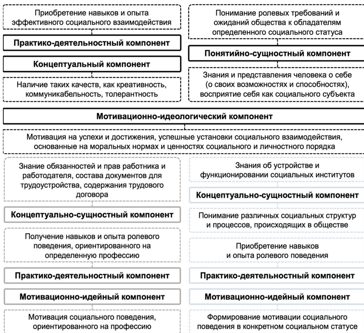
Рис. 1 / Fig. 1. Три направления развития компонентов социальной компетентности («Личность», «Профессионал», «Гражданин») / Three directions for development of social competence components (“Personality”; “Professional”; “Citizen”)