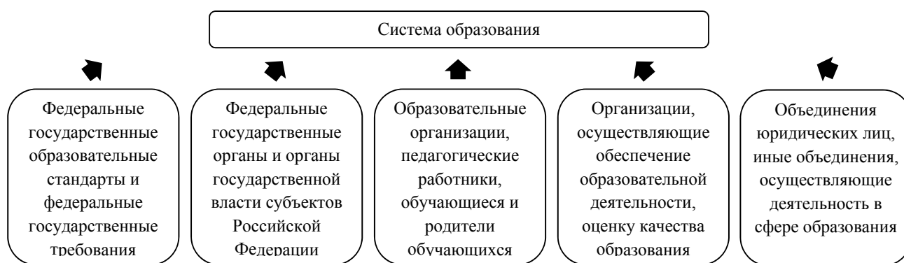
Рис. 1. Структура системы образования