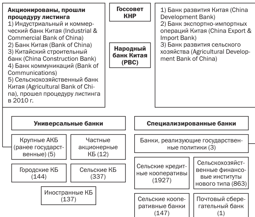
Рис. 5.1. Структура банковского сектора КНР на конец 2012 г.